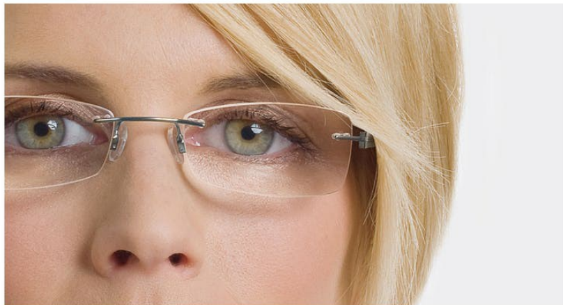
Effet "loupe" disgracieux.

Appliquez le fard à paupières en allant du coin intérieur de l'œil vers l'extérieur, et en prenant soin de ne pas dépasser le pli de la paupière. Soulignez les extrémités de la paupière à l'aide d'un eyeliner ou d'un crayon foncé. Vous pourrez ainsi atténuer l'effet grossissant de vos lunettes. Appliquez votre maquillage avec soin, car vos verres accentueront toutes les imperfections. En ce qui concerne le mascara, il convient de l'appliquer avec parcimonie sur la paupière supérieure et de ne pas en utiliser sur la paupière inférieure.