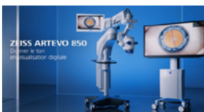
NOUVEL ARTEVO 850 3D