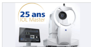
ZEISS BIOMETRY / FORMULA BATTLE