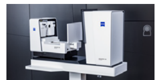
ZEISS VisuCore 500